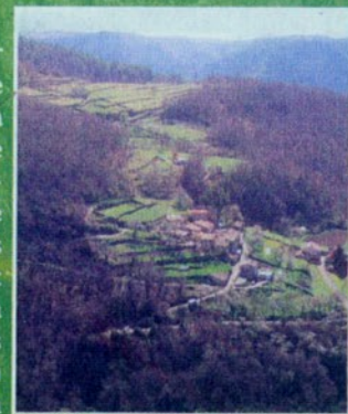
le Cros du Roure